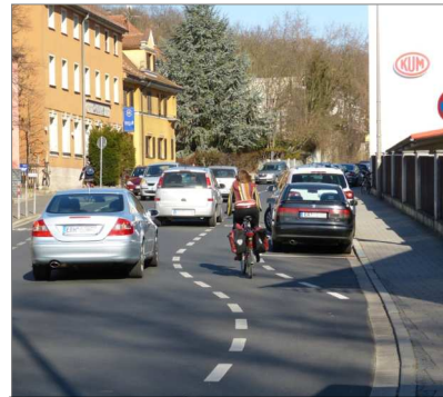
z.B. Erlangen: Radwegmarkierung

Wenn Sie weitere Anregungen haben, können Sie uns diese gerne mitteilen (z.B. per E-mail an: info@unabhaengige-uttenreuth.de ). In den nächsten Wochen ist eine Gesprächsrunde mit der Straßenbaubehörde, der Verwaltung und den Fraktionen vorgesehen, in der die eingegangenen Vorschläge erörtert werden sollen.