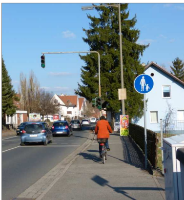
Uttenreuth heute: Radwegende

Einige Beispiele (unser komplettes Schreiben an die Verwaltung finden Sie unter www.unabhaengige-uttenreuth.de „aktuelles“):